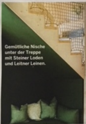
Gemütliche Nische unter der Treppe mit Steiner Loden und Leitner Leinen.

Neben den urigen Stallungen, Scheunen, dem Stadl und holzverkleidetem Haupthaus, all den Tieren und dem majestätischen Panorama der Hohen Tauern sind die beiden Baumhäuser zu etwas ganz Eigenständigem geworden. Sie fügen sich nicht nur ein, sondern sie bereichern das Leben am Taxhof. Jeden Tag aufs Neue. Für große und kleine Besucher, auf eine vielfältige und bunte Weise. www.taxhof.at