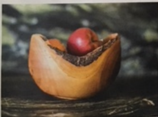
Pure Natur zum Anfassen, das ist die urige Schüssel aus Kirschholz.