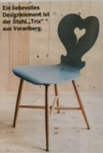
Ein liebevolles Designelement ist der Stuhl „Trix“ aus Vorarlberg.