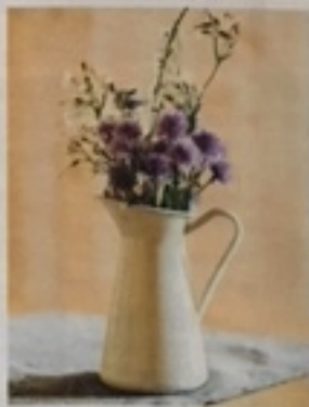
Nostalgisches Kännchen mit Blumen des Kräutergartens.