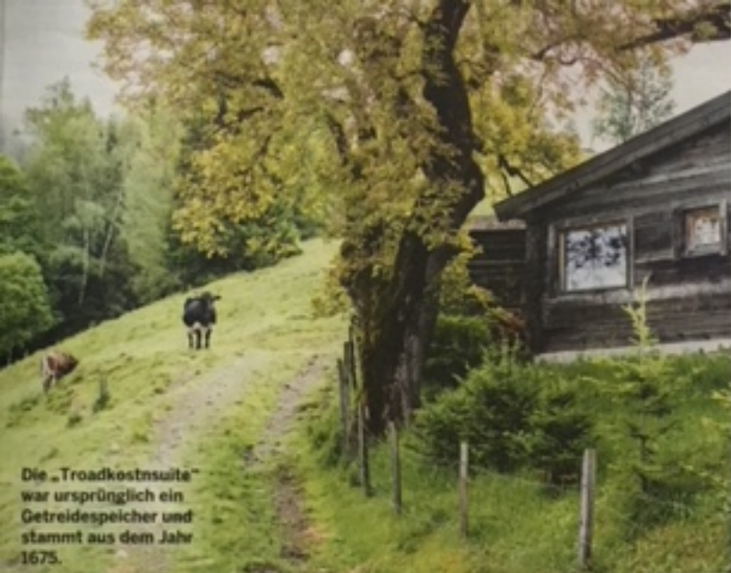
Die „Troadkostnsuite“ war ursprünglich ein Getreidespeicher und stammt aus dem Jahr 1675.